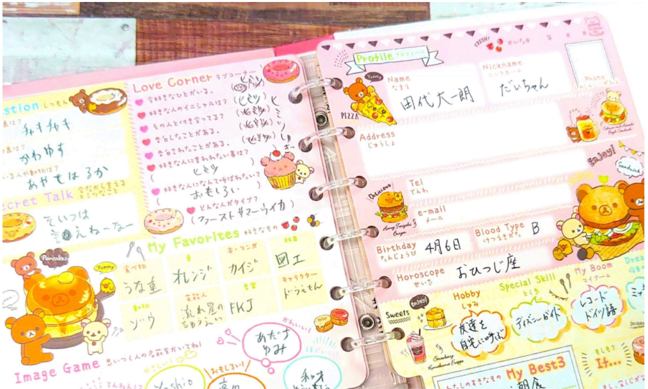
自分を映し出す不思議な鏡「サイン帳」